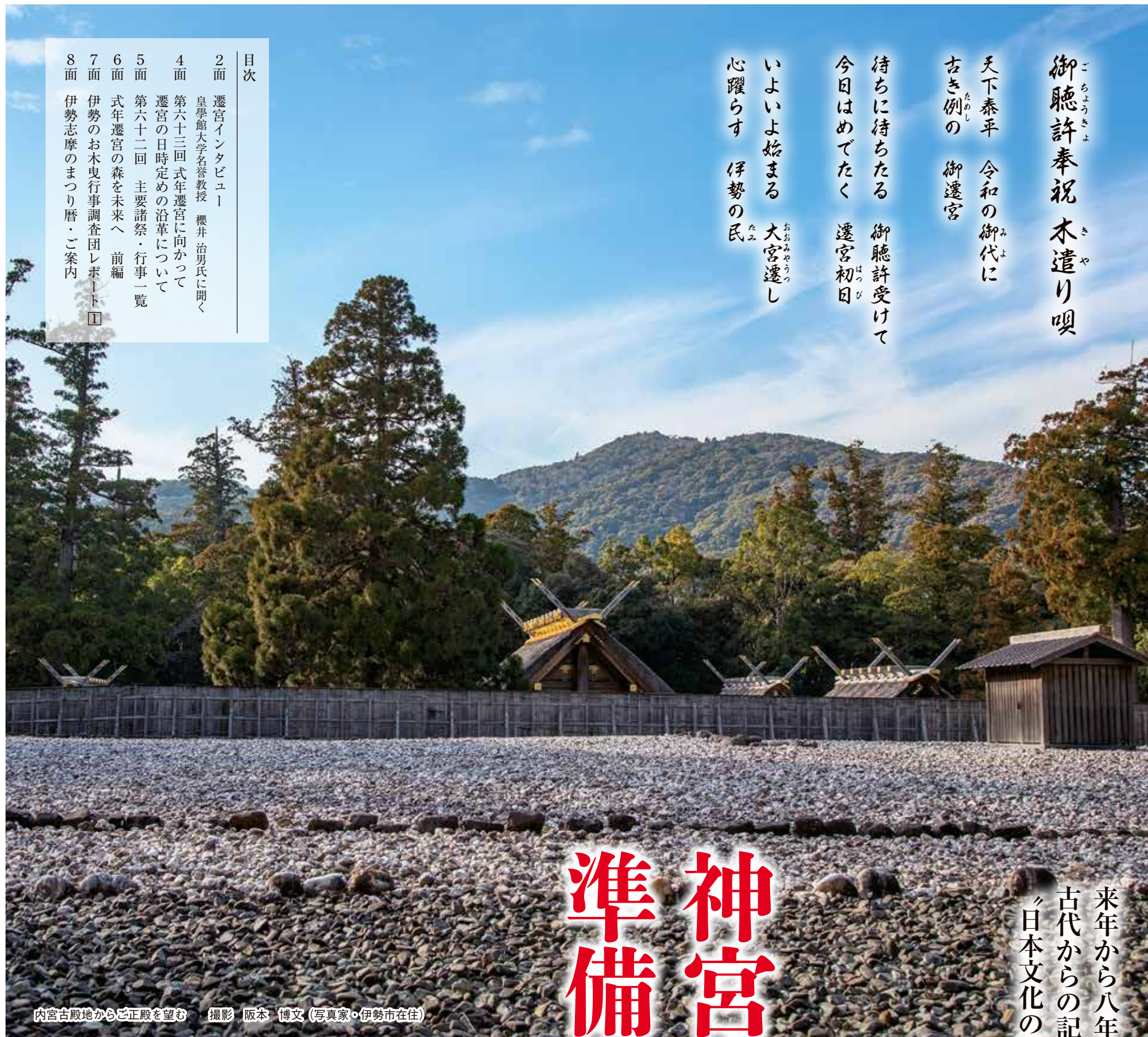
内宮古殿地から正殿を望む