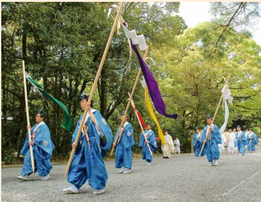
山口祭。五色の幣をかかぎて祭場へと向かう

式年遷宮は、第四十代天武天皇のご発意により、続く持統天皇四年(六九〇)に第一回遷宮が行われたという。戦国時代に中絶を余儀なくされた時