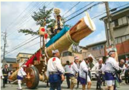
お木曳行事の陸曳は外宮へ奉曳