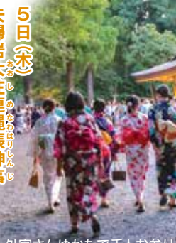
外宮さんゆかたで千人お参り

21日(土) 23日(月) 秋の神楽祭 神恩感謝を捧げ、国民の平和を祈って、内宮神苑の特設舞台上で神宮舞楽が一般公開される。春と秋に行われる。