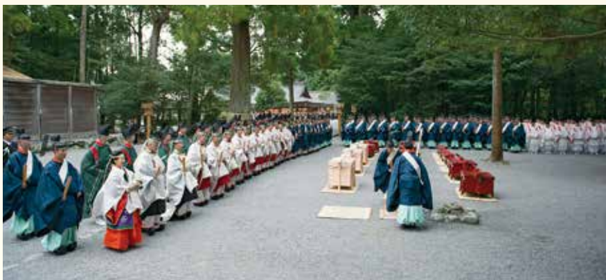
御装束神宝をはじめ遷御奉仕の神宮祭主以下の奉仕員を祓い清める「川原大祓」（外宮・平成25年）

「日本がここに集まる初詣」。毎年神宮への初詣を欠かさなかった山口誓子が詠んだ句です。祈りを捧げるために人が集まるだけでなく、その心も伝統も神宮に集まってくるのですね。