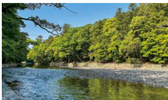
五十鈴川の源流は神宮の森にある