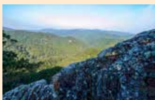
神宮林は国立公園のほぼ1割を占める

今では、景観としての価値のほか、貴重な照葉樹林、暖帯林としての位置づけや、そこに生息する多様な動植物、また、五十鈴川から伊勢湾へと連なる水系が果たす役割、さらには多くの国民が参拝される伊勢神宮が鎮座する場所という文化的価値など、伊勢志摩国立公園と神宮の関わりは非常に深く、互いにその価値を高め合う関係となっています。