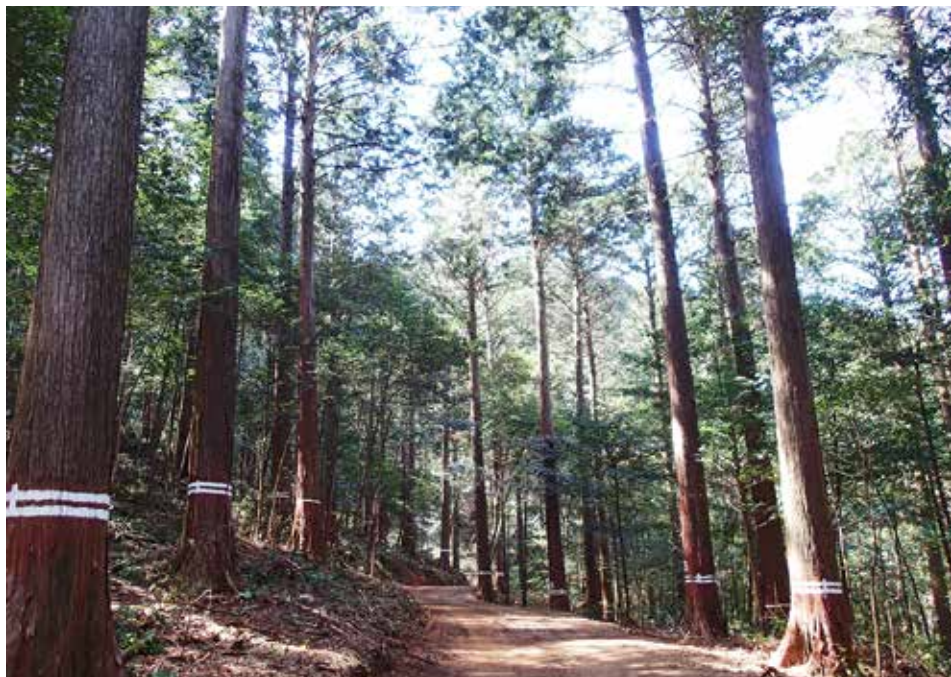
神宮の宮域林で育つヒノキ