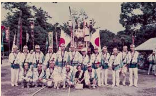
お白石持奉獻に大学教員や仲間と参加（昭和48年）