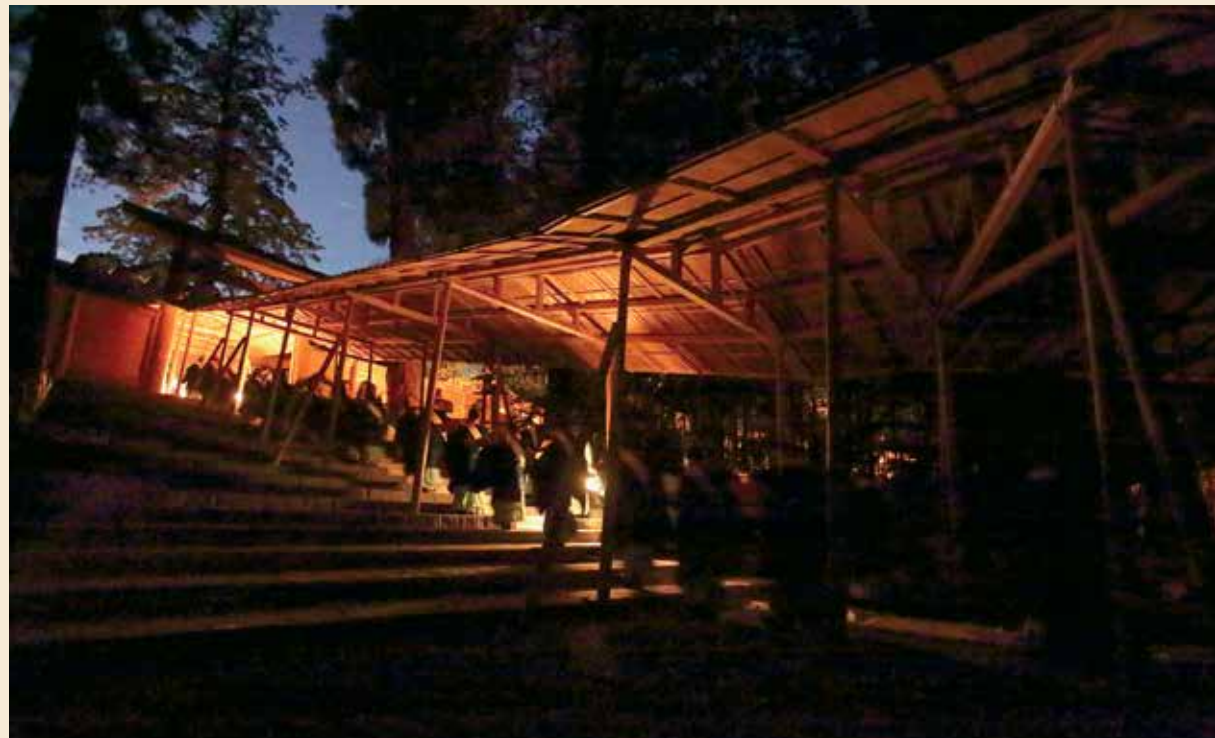
式年遷宮で最も重要な神事「遷御の儀」。神聖な間の中、御神体が新宮に遷る（内宮・平成25年）