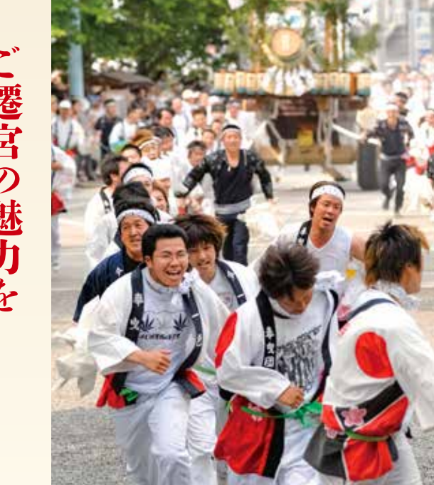
御用材を内宮外宮の神域に運び入れる「お木曳行事」（平成18・19年）

てはなりません。また伊勢におりますので、ご遷宮といえば「お木曳」と「お白石持」がセットです。神宮と人々がつながる領域があり、この行事によって式年遷宮に参加したという意識が芽生えます。